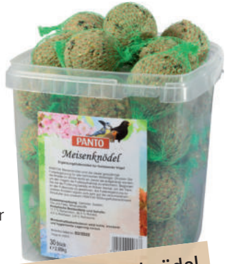
PANTO® Meisenknödel 30er-Eimer