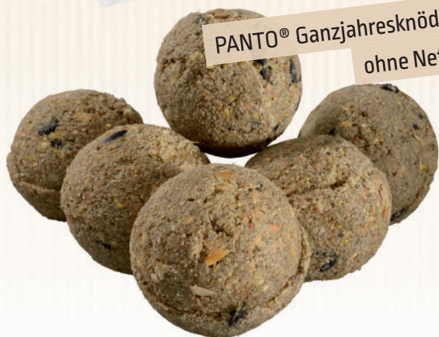
PANTO® Ganzjahresknödel ohne Netz