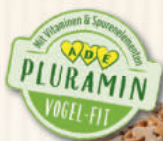
PANTO® Premium Streufutter schalenlos