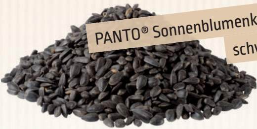
PANTO® Sonnenblumenkerne schwarz