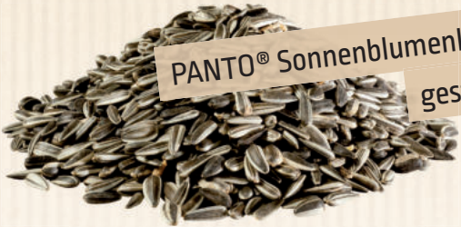
PANTO® Sonnenblumenkerne gestreift