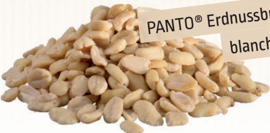
PANTO® Erdnussbruch blanchiert