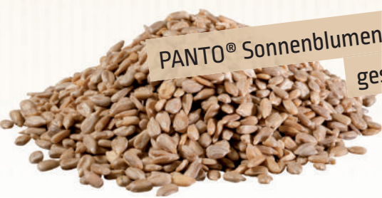
PANTO® Sonnenblumenkerne geschält